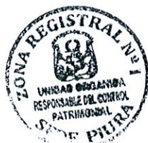
RODDY MOGOLLON SAAVEDRA Responsable (e) del Control Patrimonial